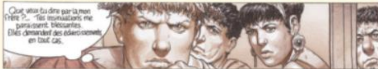
DOC 3 Murena, Dufaux et Delaby, tome II, 1999, Dargaud.

3 Lisez la bande dessinée (doc. 1). En quoi le testament de Claude peut-il avoir de l'importance ?