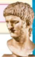
Néron, tête en marbre, I er s. ap. J.-C., Musée national romain, Rome.

Statura fuit prope justa, ● corpore maculoso et fetido, ● subflavo capillo, ● vultu pulchro magis quam venusto, ● oculis caesiis et hebetioribus, ● cervice obesa, ventre projecto, ● gracillimis cruribus, validudine prospera : ●