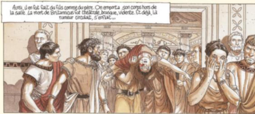
DOC 2 Murena, Dufaux et Delaby, tome II, 1999, Dargaud.

Peu après avoir parlé, et alors même qu'il n'a pas bu son verre, Britannicus s'effondre et meurt soudainement.