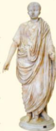
Britannicus, statue en marbre, Musées du Vatican, Rome.

5 Dans ce témoignage, qu'est-ce qui fait de Néron le coupable idéal ?